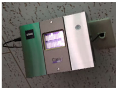
Care222という機材を人の行交う廊下の 天井に設置 人に影響がない程度の紫外線で、付着 した菌を除去します