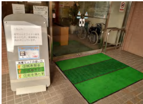
入口全てに消毒マットを設置 靴裏からの感染対策を行っています