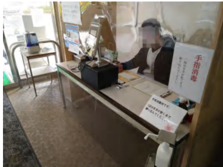
入館時、常駐スタッフによる問診チェック にご協力頂いております