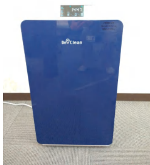
オゾン発生タイプの空気清浄 機を診察室等に設置 空気中でのオゾンは不安定で、 空気中の細菌と合体すること で、安定を求めようとする性質 を利用しています