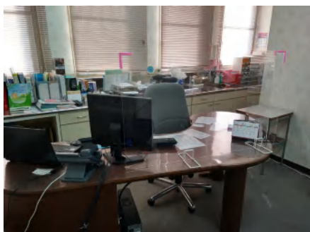
受付や診察室等には透明なパーティ ションを設置してます